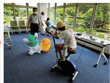
(推) イベント参加者に対し、笑顔で親切かつ丁寧に対応していただき、大変好印象でした。

eco ポップふれあいフェス 発電体験 2023/7/23 @ 諏訪湖周クリンセンター ● 親子向け