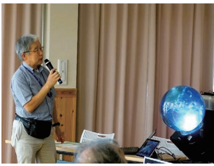
(推) 大気汚染・オゾン・森林火災・海氷などを見てみたいというリクエストが多かったです。

* 写真下のコメントは、実施報告書に記載された推進員によるコメント = (推)、主催者による感想・意見等 = (主) から抜粋しました。