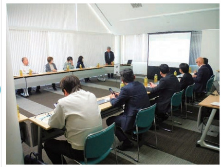
(主) 大変分かりやすく丁寧な講演でした。

ゼロカーボンへ向けた 事業所の省エネ対策 2023/5/16 @ 小諸商工会議所 ● 行政