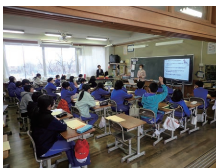
(推) 卒業の思い出となるような講座をすることができて、本当に良かったと思います。

家庭科「持続可能な暮らしへ」 環境や資源に配慮した生活 2024/2/21 @ 安曇野市立明南小 6年生 ● 学校