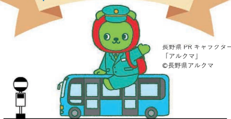
長野県 PR キャラクター 「アルクマ」 ©長野県アルクマ

2050 ゼロカーボンの実現に向けて CO 2 の排出を抑えた エコな移動 を 体を動かさず きつかけづくり にも♪