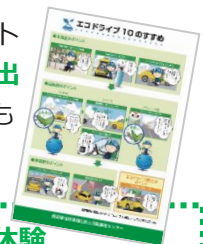
イラスト 満載の 貸出 用パネル も あります

*詳しくは COOL CHOICE ホームページ（▼脱炭素アクション「エコドライブ」）へ