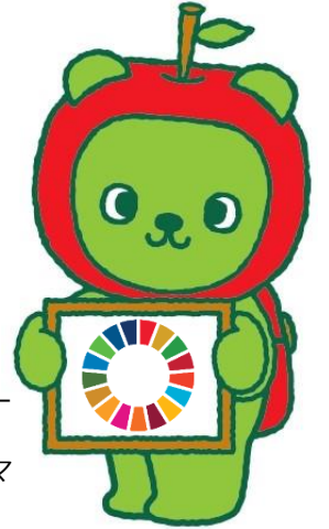
長野県 PR キャラクター 「アルクマ」 ©長野県アルクマ

め かず おな もじすう ことば マス目の数と同じ文字数の言葉を 「ことばリスト」(赤字)から えら 選んであてはめてね。