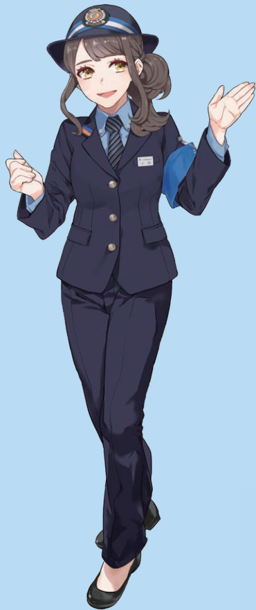
しなの鉄道 鉄道むすめ