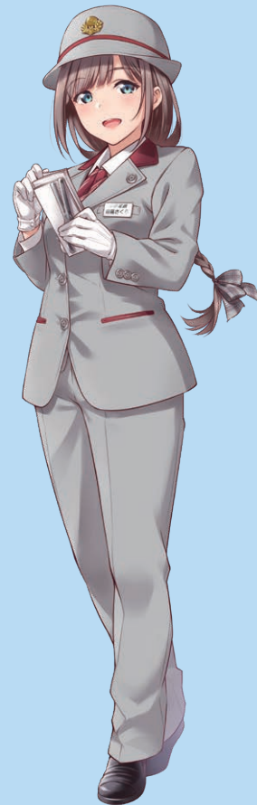
長野電鉄 鉄道むすめ